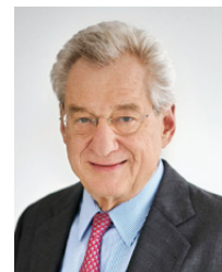
海因里希-魏斯博士 (Heinrich Weiss) 西马克集团股东委员会主席