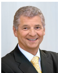
Edwin Eichler 西马克集团监事会主席